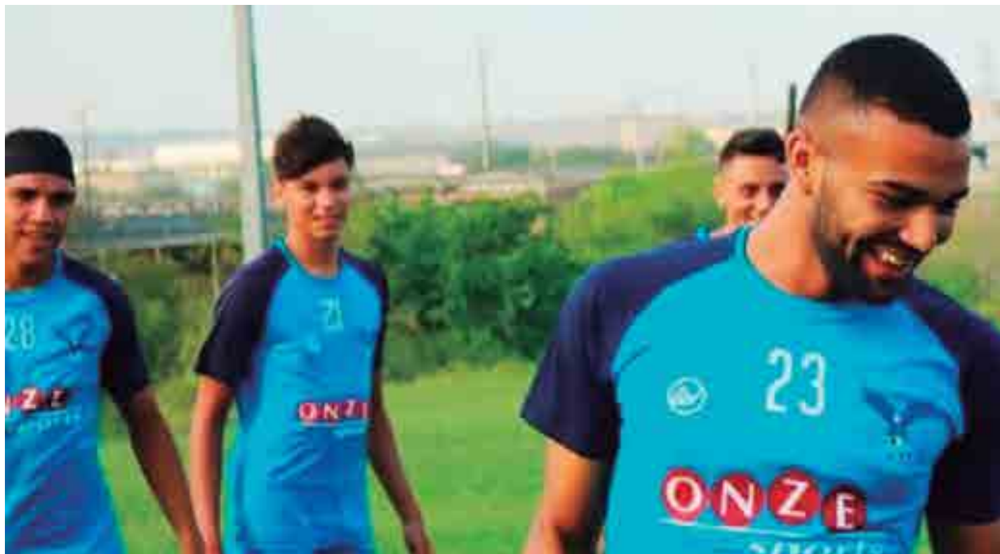
Campeão Paraibano Sub-19, a equipe da Perilima segue realizando a sua preparação no centro de treinamentos do clube, em Campina Grande

Antes disso, a equipe realizará dois jogos amistosos contra a equipe do Retrô FC de Pernambuco, time que