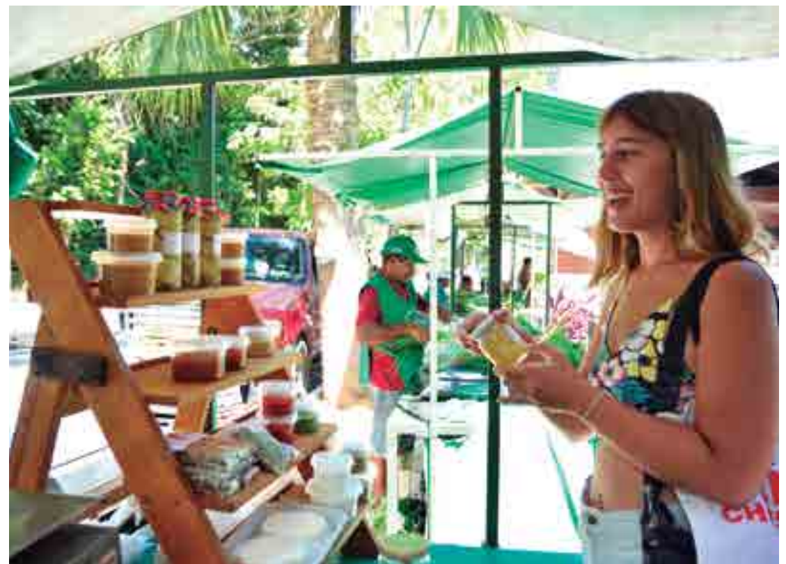
Feira acontece todas as manhãs de sexta-feira no pátio externo ao lado do Centro de Vivências na UFPB

sede localizada na UFPB e toda sexta-feira lancha na barraca da tapioca. Ele que é consumidor fiel da feira, ressalta a importância da feira como instrumento de fortalecimento da economia solidária. “Trabalho na área da economia solidária e defendo a ideia que o coletivo e a comunidade juntos conseguem mudar a sua realidade e a local. A feira é um conjunto de pessoas que se juntam para criar um movimento e proporcionar aos consumidores qualidade de vida, ao oferecer um produto de qualidade a preço justo”, ressaltou.