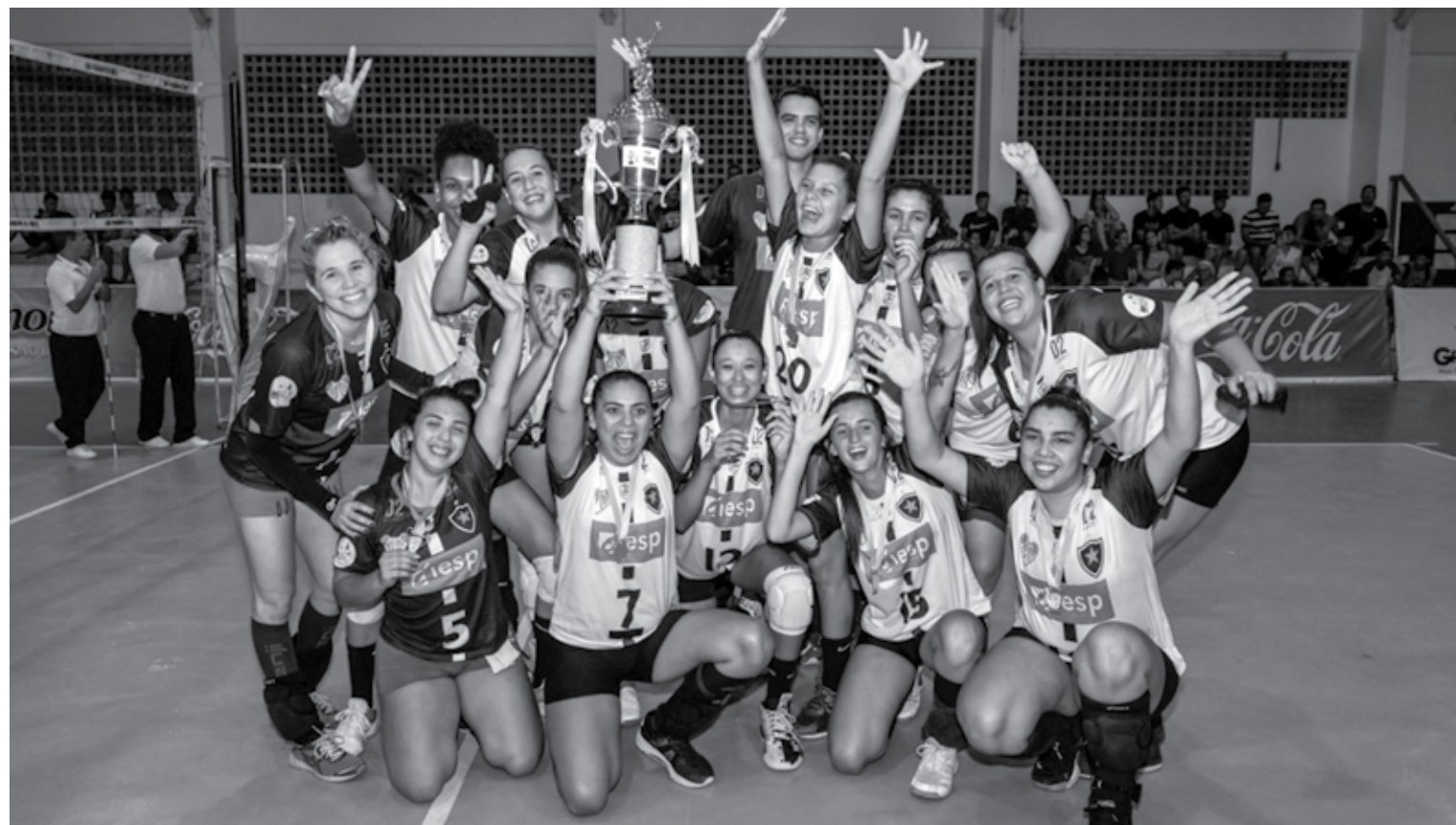
O IESP/Cabo Branco/Botafogo-PB derrotou a Uninta por sete a zero na sua oitava vitória na Liga Paraibana de Voleibol. O time masculino também foi campeão