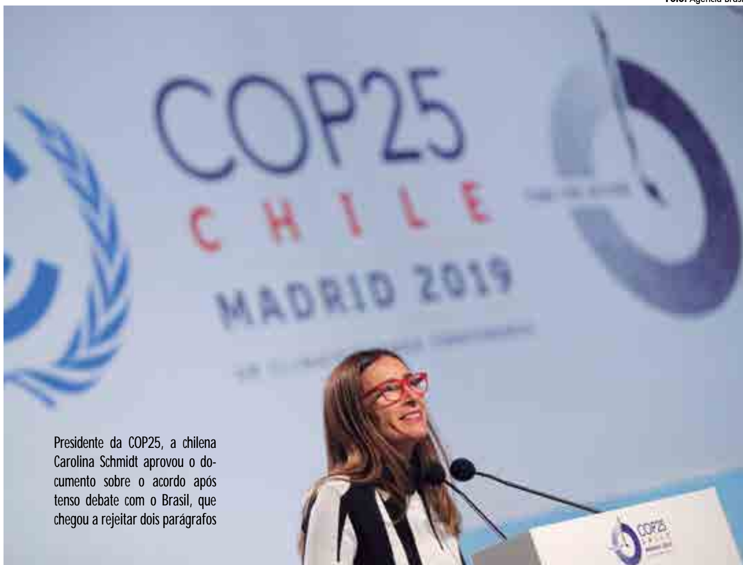
Presidente da COP25, a chilena Carolina Schmidt aprovou o documento sobre o acordo após tenso debate com o Brasil, que chegou a rejeitar dois parágrafos

As várias delegações, de 200 países, não conseguiram chegar, na sexta-feira (13), a acordo sobre como impulsionar as metas do Acordo de Paris. As organizações ambientalistas acusaram a presidência chilena de estar cedendo aos interesses dos países poluidores, como os Estados Unidos e o Brasil.