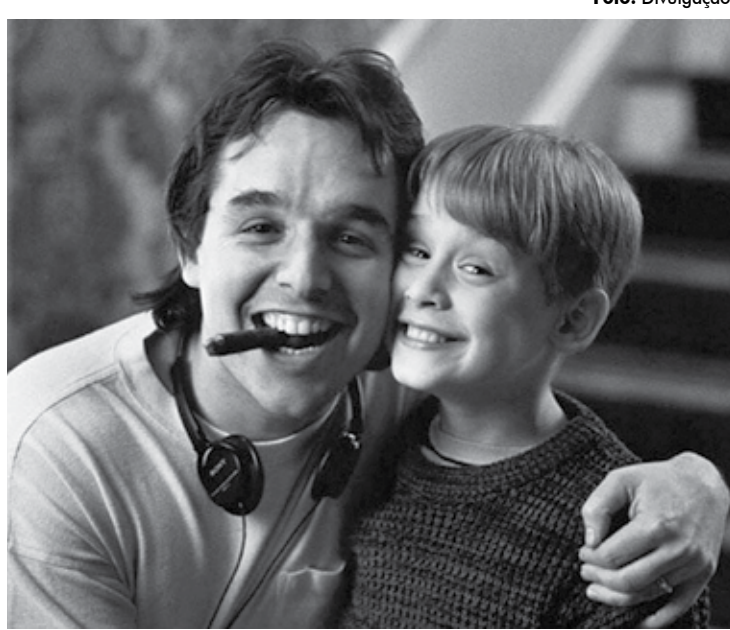
Chris Columbus e Macaulay Culkin nos bastidores de 'Esqueceram de Mim'

Já Os Caça-Fantasmas foi todo rodado sem a confirmação de que iria sair com esse título. Iniciamento chamado Ghost